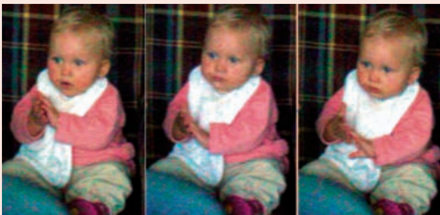
Lies gebaart brood.

Zo kunnen zij ouders bijvoorbeeld verwijzen naar een bepaald voorbeeldfilmje waarin het gebaren op het lichaam van het kind zichtbaar is. De cursus bestaat uit een dvd/videoband en werkboek voor de cursisten en een dvd en docentenhandleiding voor de docenten.