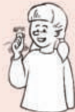
Gebaar voor rammelaar.

handjes van het kind, gebaren maken op het lichaam van het kind en gebaren uitvergroten. Het maken van gebaren op het lichaam van het kind zorgt ervoor dat het kind bij het gesprek betrokken blijft.