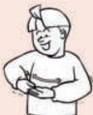
Gebaar voor baby.

Het communiceren met een slechthorend of doof kind vraagt een visuele en manuele benadering van het kind, in plaats van een auditieve en orale. Juist deze communicatieve vaardigheden moeten horende ouders leren toepassen. Omdat het van belang is dat ouders leren hoe ze contact maken en houden met hun ernstig slechthorende en dove kind, zijn ook aandachtstrategieën een onderdeel van de cursus. Voorbeelden hiervan zijn: gebaren maken met de